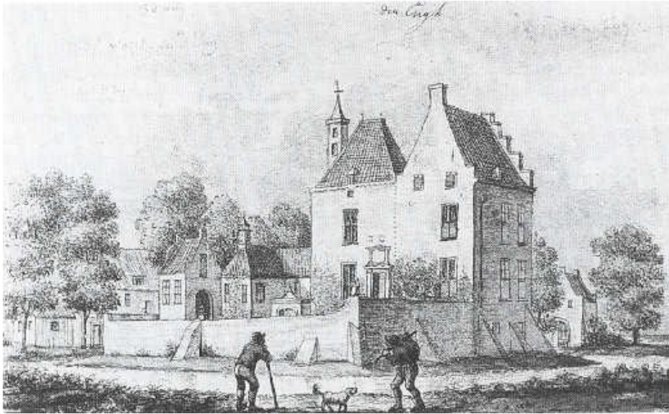
kasteel Den Engh

Volgens het Nederlands woordenboek betekent Eng of Enk een "stuk bouwland dikwijls hoger gelegen dan het omringende land". De oorspronkelijke betekenis is een stuk "gemeenschappelijk bouwland der markgenoten", d.w.z. de gronden die van oudsher in onverdeeld eigendom worden bezeten door marken of buurtschappen. Zo komt het woord voor in plaatsnamen als Enkhuizen en Engwierum.