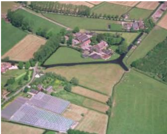
Boerderij en kasteelterrein van Den Engh (1998)

De familienaam komt mogelijk van het kasteel Den Engh, waar sommigen de naam kregen van "Van den Engh". Den Engh, Den Eng of Den Enge is een "ridderhofstad" in de provincie Utrecht, ten zuiden van Maarsse en ten